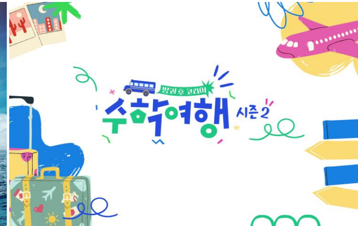
방과 후 코리아: 수학여행 시즌2

육아 전쟁으로 지친 아빠들을 위한 '글로벌 육아 반사회'. 한국에서 살아가는 외국인 아빠들의 고군분투 리얼한 육아를 통해 부모는 물론 아이도 행복해지는 비밀을 찾는 프로그램.