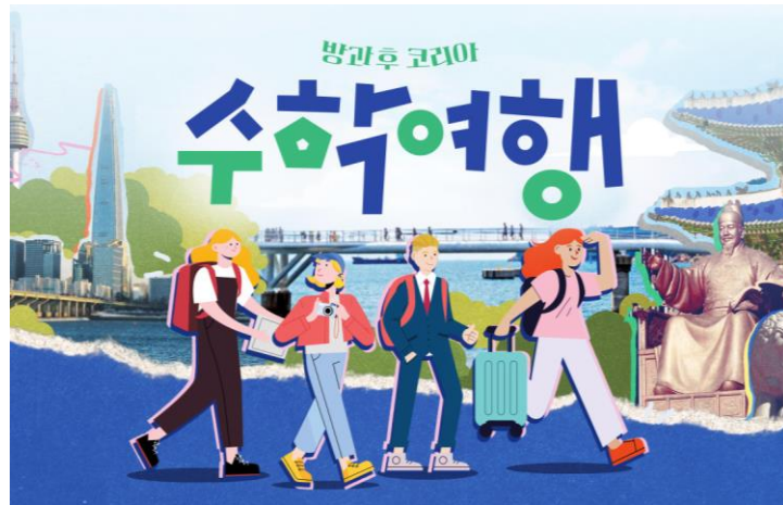
방과 후 코리아: 수학여행

코로나19 비상사태 종식으로 인한 해외 현지 촬영 프로그램의 증가와 더불어 예능 뿐만 아니라 다큐멘터리와 웹 콘텐츠 제작에도 힘쓰며 세계 진출이라는 팀노크의 장기적인 비전을 실현하고자 노력하고 있습니다.