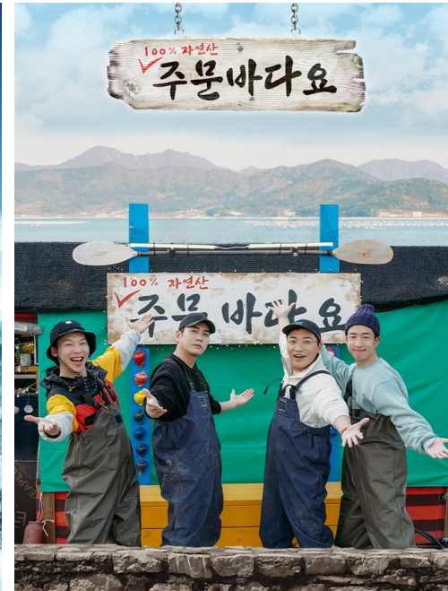
주문 바다요 MBC every1