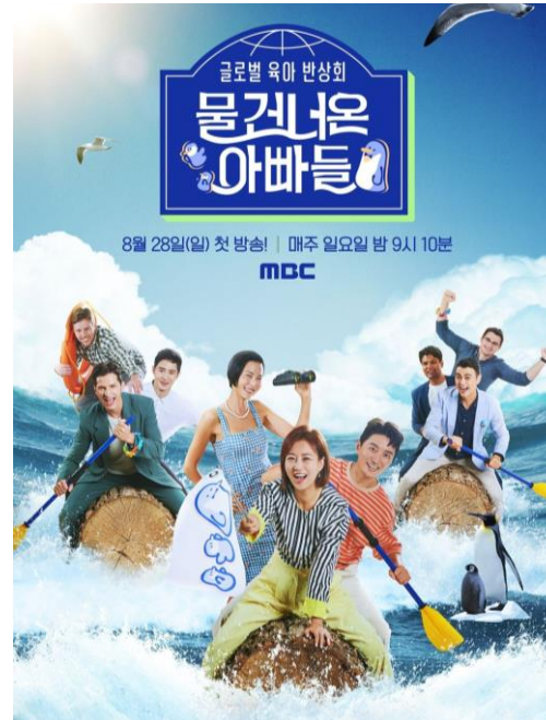
물 건너온 아빠들 MBC