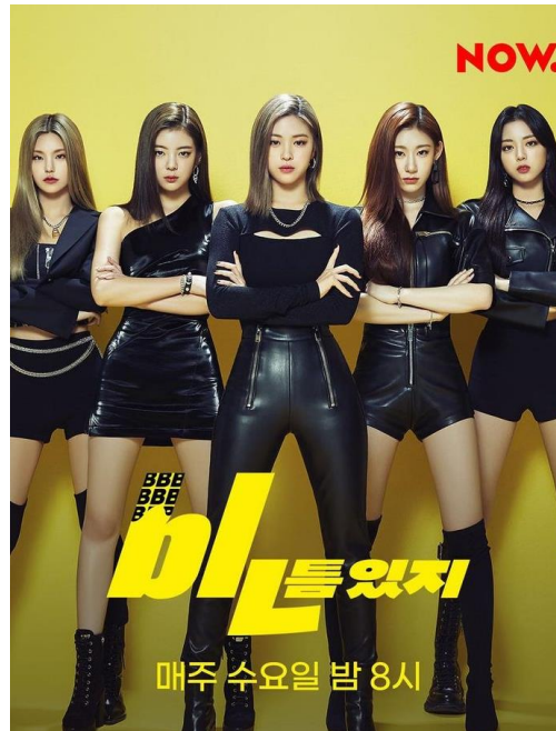
B | N | M | T | M | T | M Naver NOW