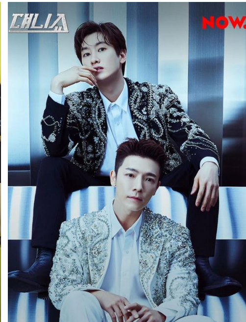
대니쇼 Naver NOW