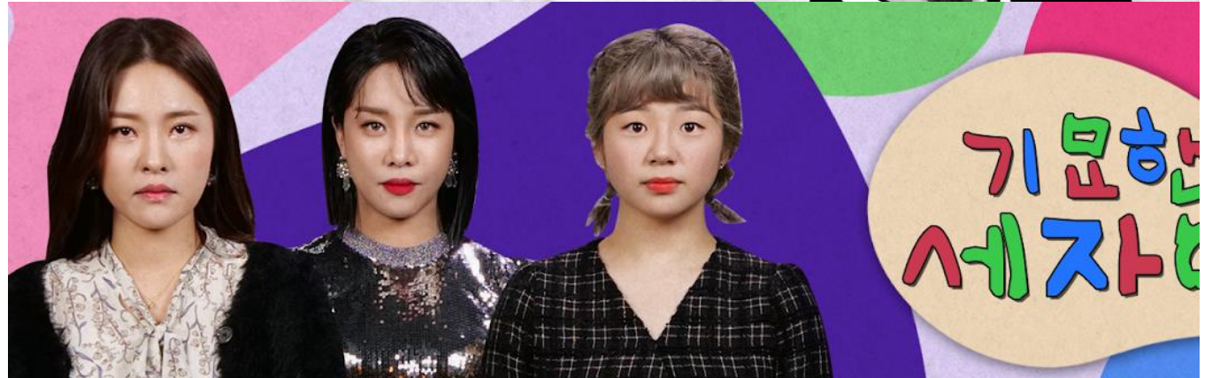
기묘한 세자매