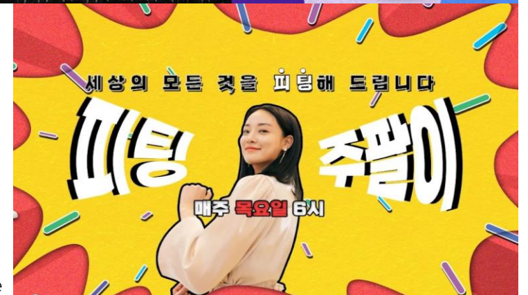
피팅 주팔이 ATA / Youtube