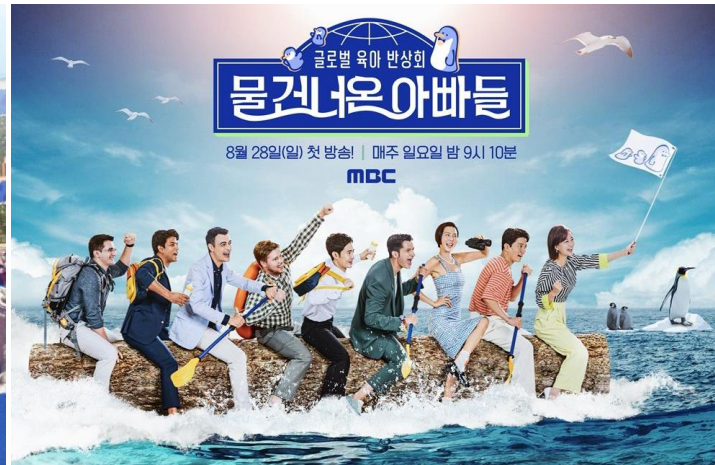
물 건너온 아빠들

한국에 관심이 많은 해외 10대 학생들이 단체로 한국으로 수학여행을 와서 한국을 더 깊이 알고 사랑하게 되는 과정을 그린 프로그램.